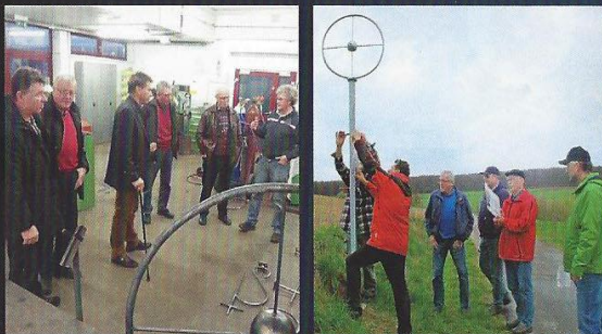
Schüler der Berufsbildenden Schule Lahnstein fertigten als Jahresprojekt die Trägerpfosten mit den Symbolen, die Bettendorfer Ehrenamtliche in 2015 entlang des 3 KR maßstabsgerecht aufstellten. Ab der Station Sonne in Bettendorf bis zur Station Pluto in Holzhausen (oder umgekehrt) kann der Wanderer jetzt die Abstände unseres Sonnensystems erwandern.