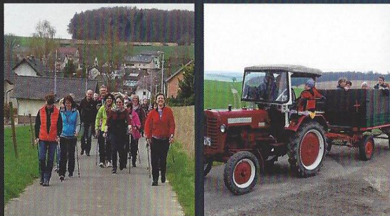
Die Strecke lädt zur Erkundung zu Fuß, mit dem Rad oder dem Oldtimer-Traktor ein.