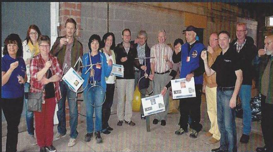
Ehrenamtliche Aktive, Bürgermeister und Landrat starten das Projekt „Planetenlehrpfad am 3 KR“ bei Limeslive 2014 in Bettendorf und konnten zum Frühlingserwachen 2016 den Weg freigeben.